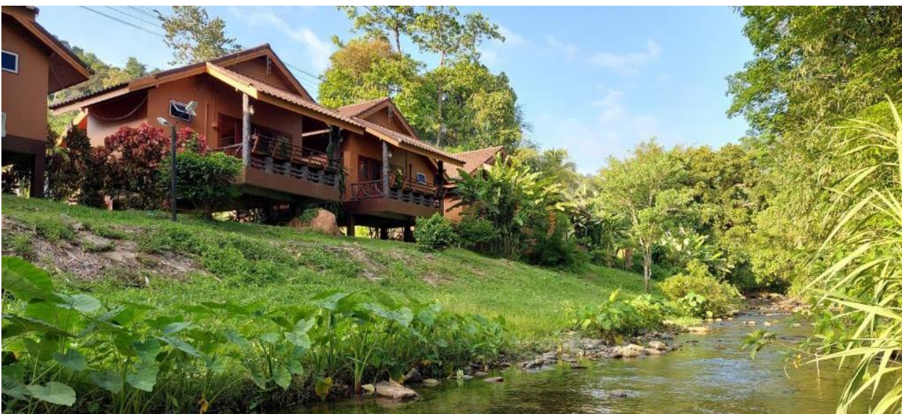
Khao Sok Rainforest Resort