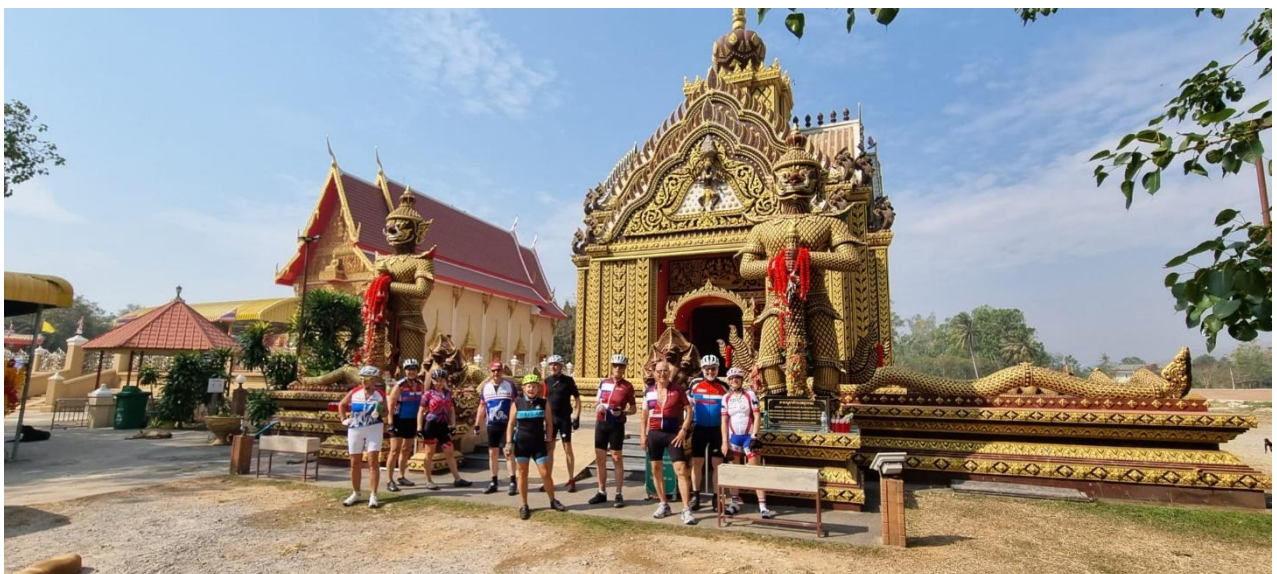
Wat Khao Kalok Tempel Prachuab Khiri Khan