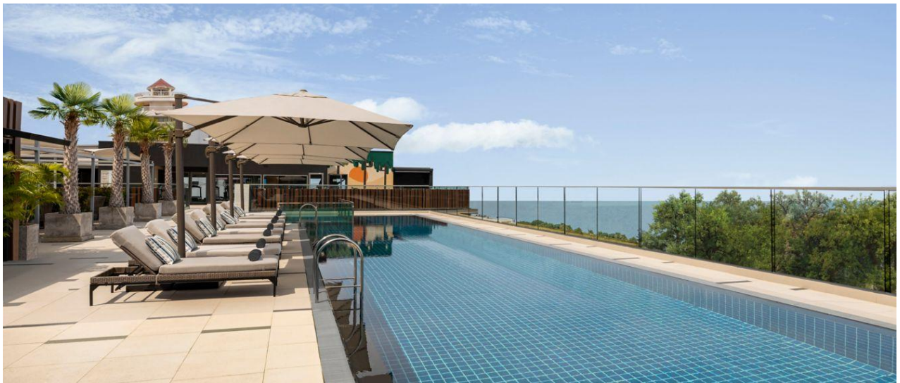
Rooftop Pool im Courtyard by Marriott North Pattaya