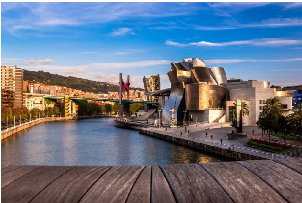
Guggenheim Museum, Bilba

Unser heutiges Etappenziel Eibar liegt eingebettet in ein schmales, von grünen Hügeln umgebenes Tal. Die Stadt hat eine lange Tradition im Metall- und Waffenhandwerk und war einst ein Zentrum für spanische Industriekultur.