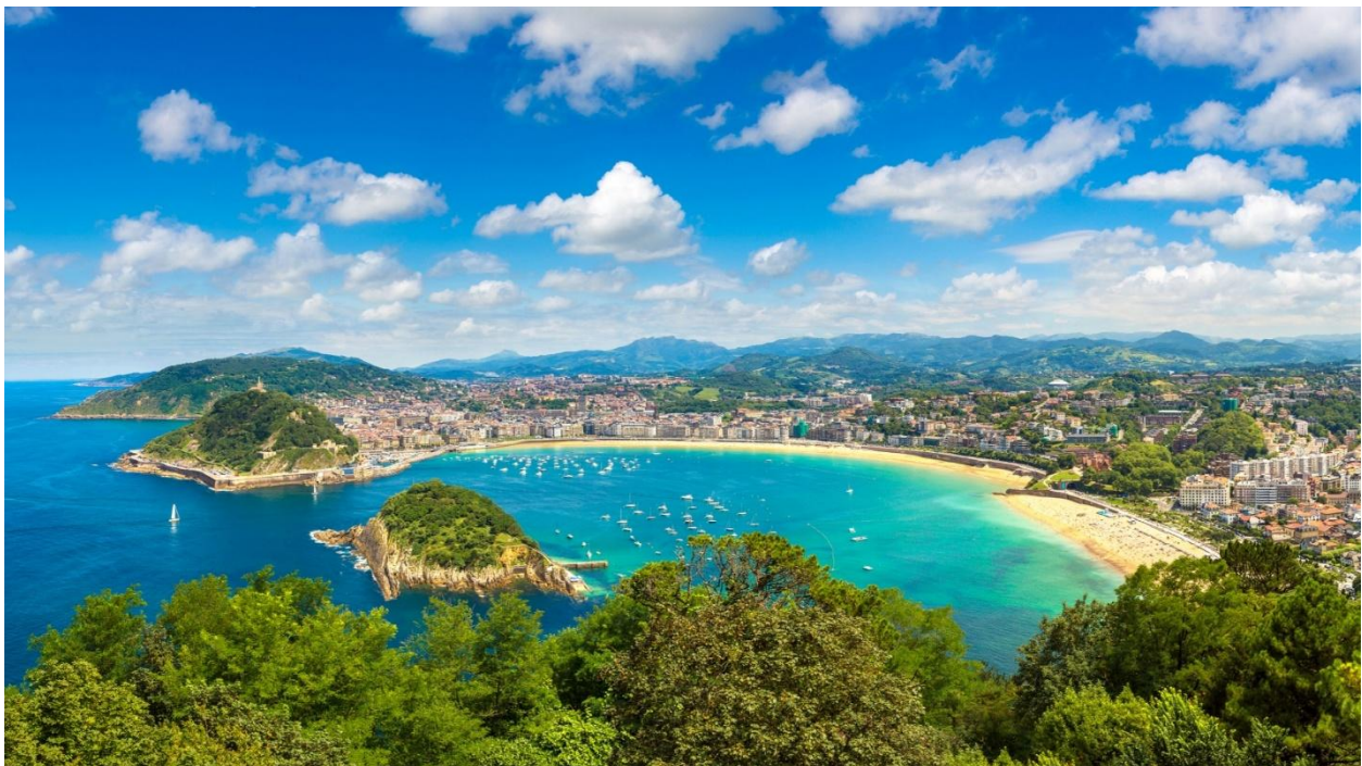
San Sebastian

Übernachtung, Abendessen und Frühstück: Hotel Eurostars Amara Plaza