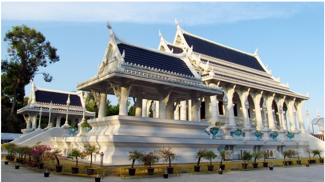
Tempel Südthailand

Am Morgen zwei Bustransfers zum Flughafen Phuket. Alternativ bietet sich eine Verlängerung in Natai Beach an.