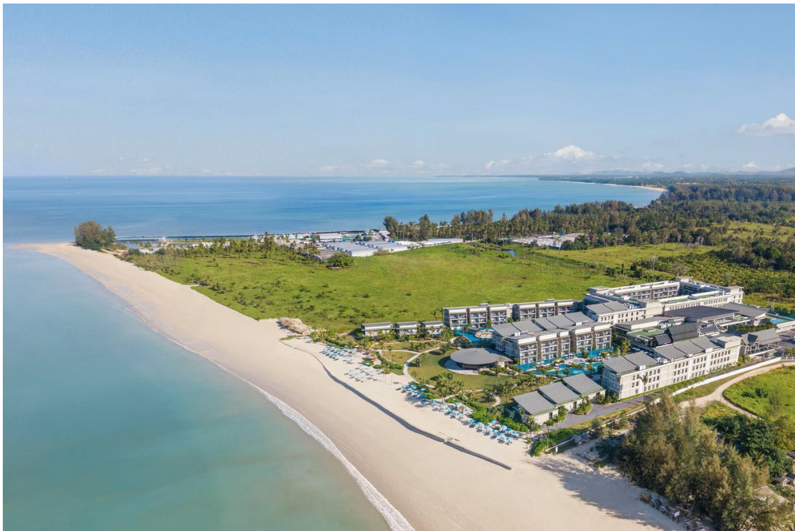
Hotel Le Méridien, Khao Lak